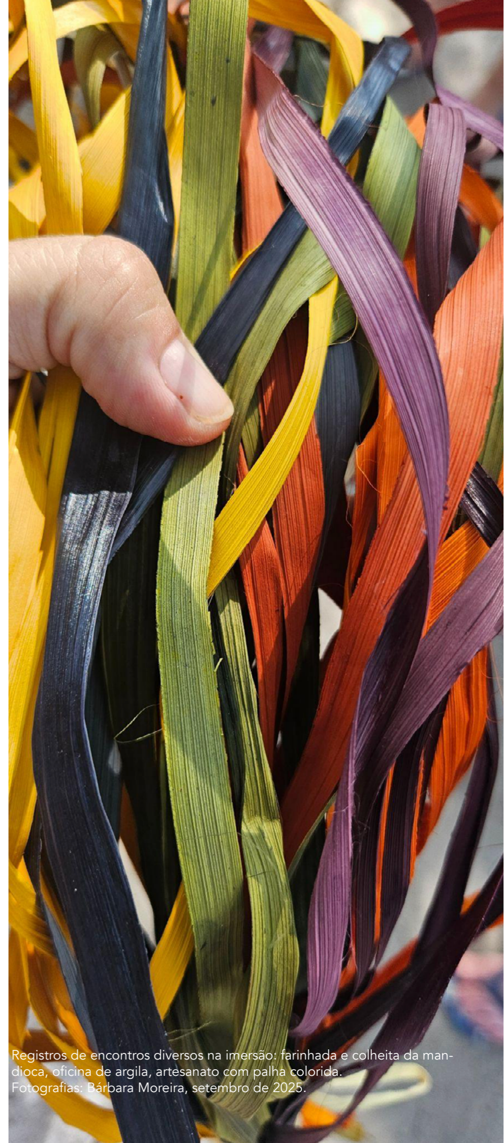
Registros de encontros diversos na imersão: farinha e colheita da mandioca, oficina de argila, artesanato com palha colorida. Fotografias: Bárbara Moreira, setembro de 2025.