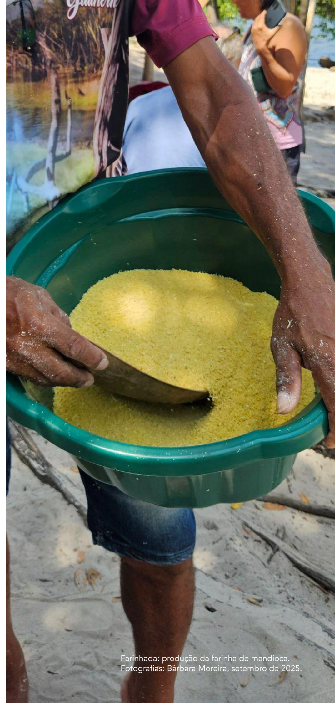
Farinhada: produção da farinha de mandioca. Fotografias: Bárbara Moreira, setembro de 2025.