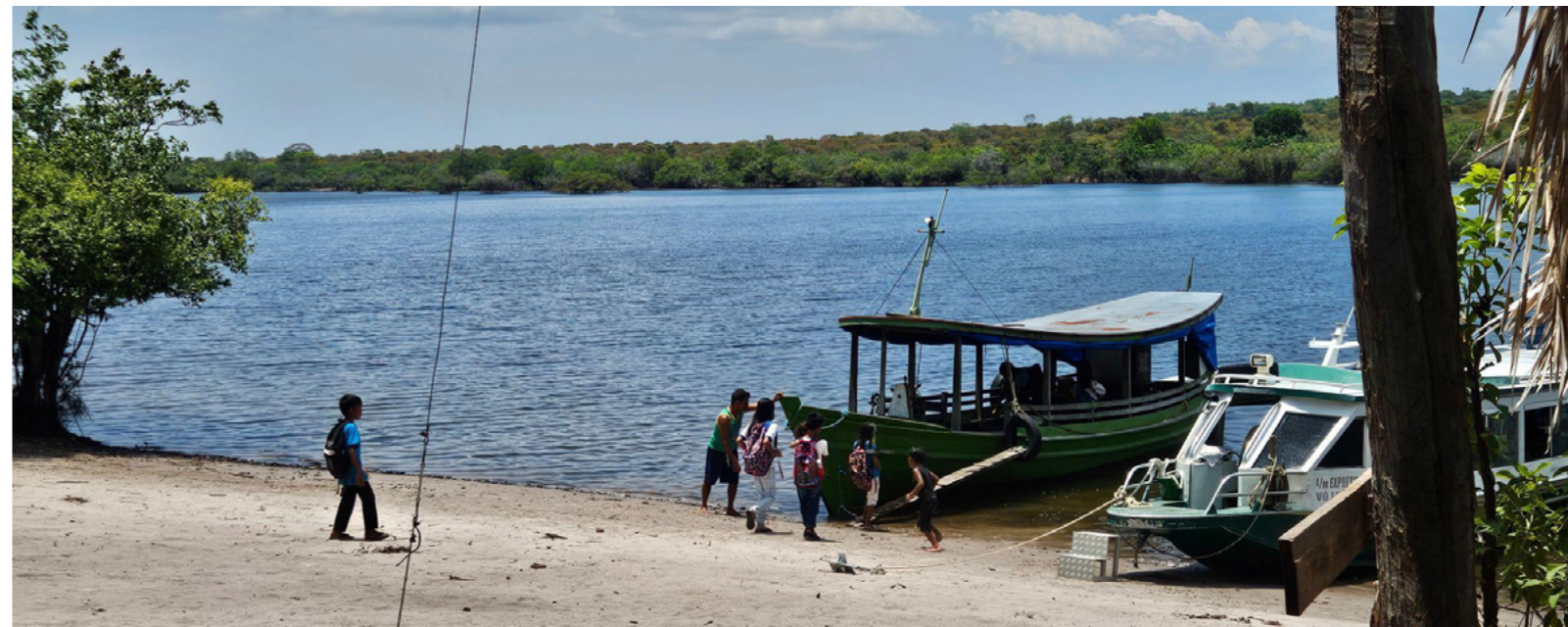
Crianças da comunidade ribeirinha de Arapiuns entram no barco para ir à escola. Fotografia: Bárbara Moreira, setembro de 2025.

Bárbara Moreira - Setembro/2025 - Fevereiro/2026