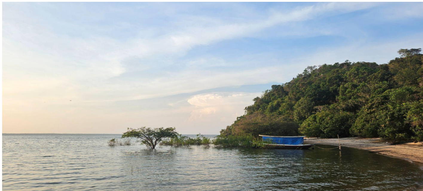
Rio Arapiuns no final da tarde. Fotografia: Bárbara Moreira, setembro de 2025.

As novas ideias falam de aceitar que somos natureza, entender as passagens dos ciclos, aceitar que o que é velho precisa ir embora para o novo chegar. Ciclos da natureza também nos habitam. Há tempo de semear, de cultivar, de colher e de descansar. “Estamos imersos num oceano cósmico de ciclos que começam e terminam dentro e fora de nós” (Bley, 2022: 45).