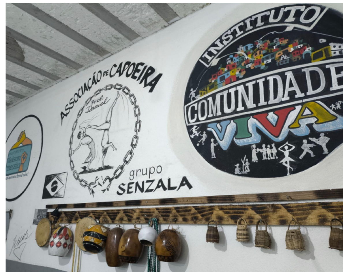
Imagem 2- Um espaço para a expressão e escuta