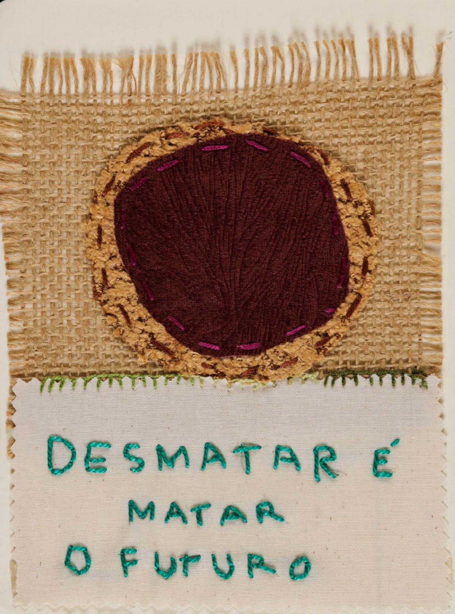
Imagem 8 - Desmatar é Matar o Futuro - bordado de participantes do grupo - Fotografia de João Caldas

"Saneamento básico é saúde pública. Quando jogamos futebol, a água do canal inunda o campo e sentimos coceira. Precisamos de contenção."