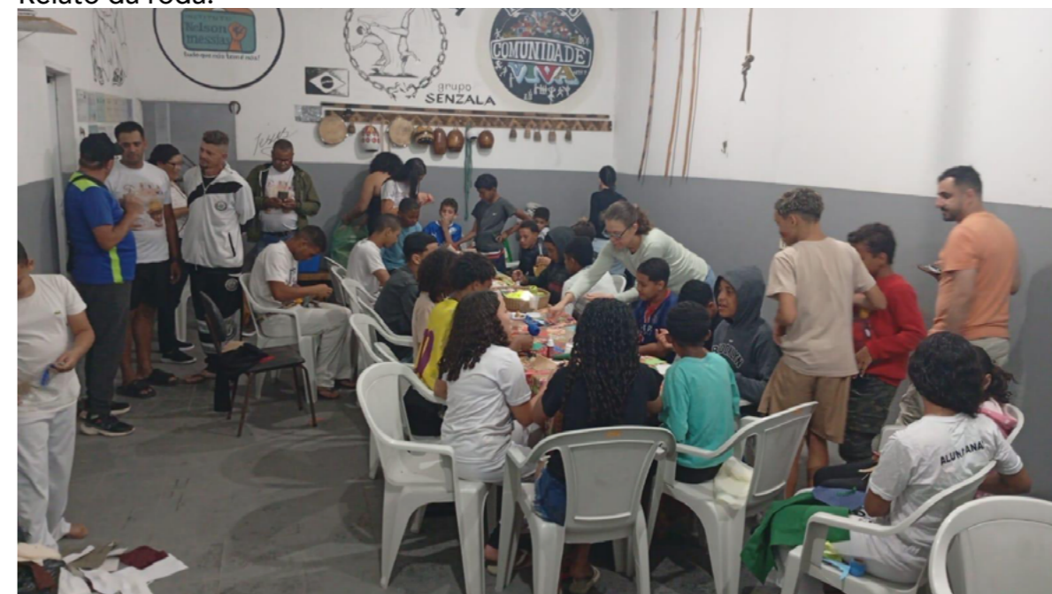
Imagem 3 - A grande roda