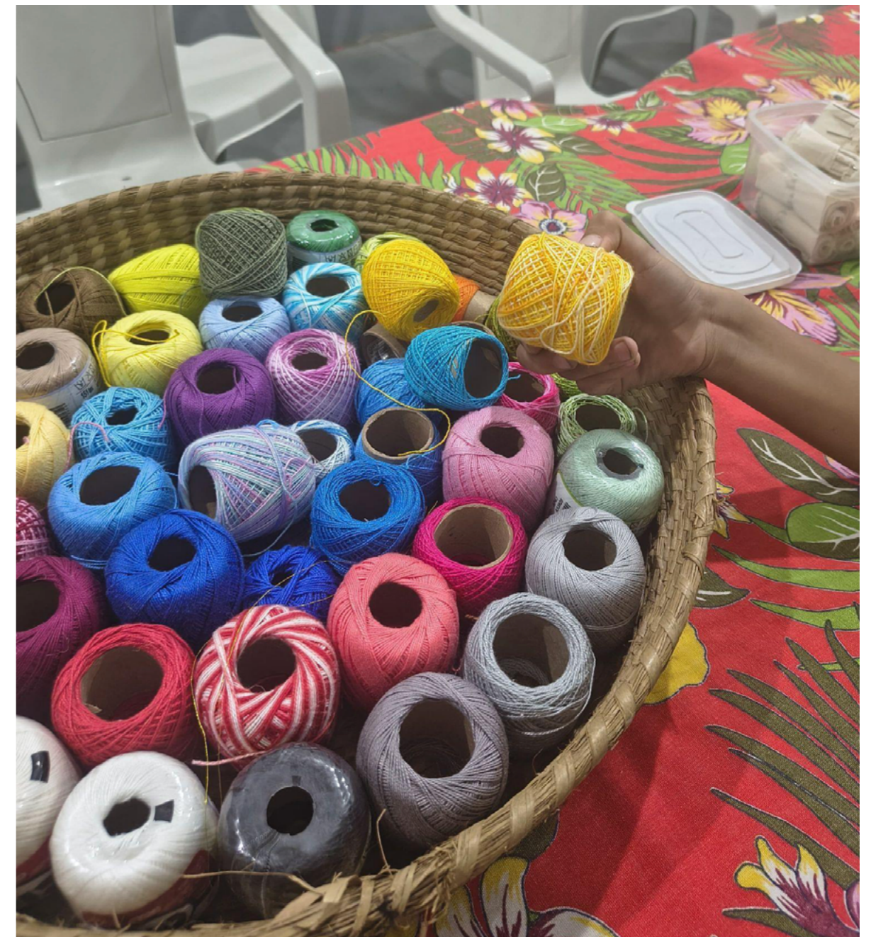
Imagem 1- As cores da manifestação gentil

Keywords: art and politics; climate justice; embroidery; social participation; territory.