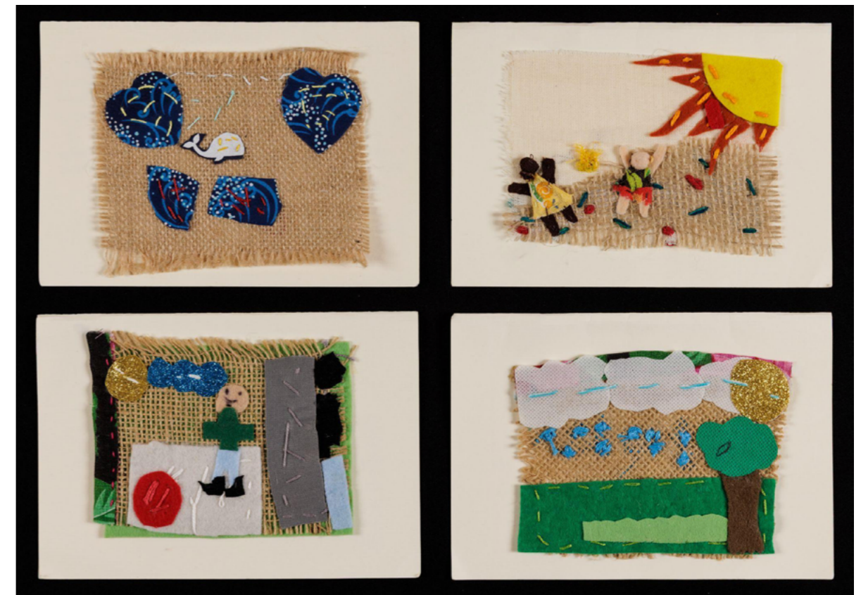
Imagem 11 - Encontros - Bordados de participantes do grupo - Fotografia de João Caldas

Essa percepção ecoa a compreensão apresentada por Krenak, para quem a Terra não é um recurso, mas um organismo vivo com o qual estabelecemos relações de reciprocidade (KRENAK, 2019). A crise climática revela, antes de tudo, uma crise de relação.