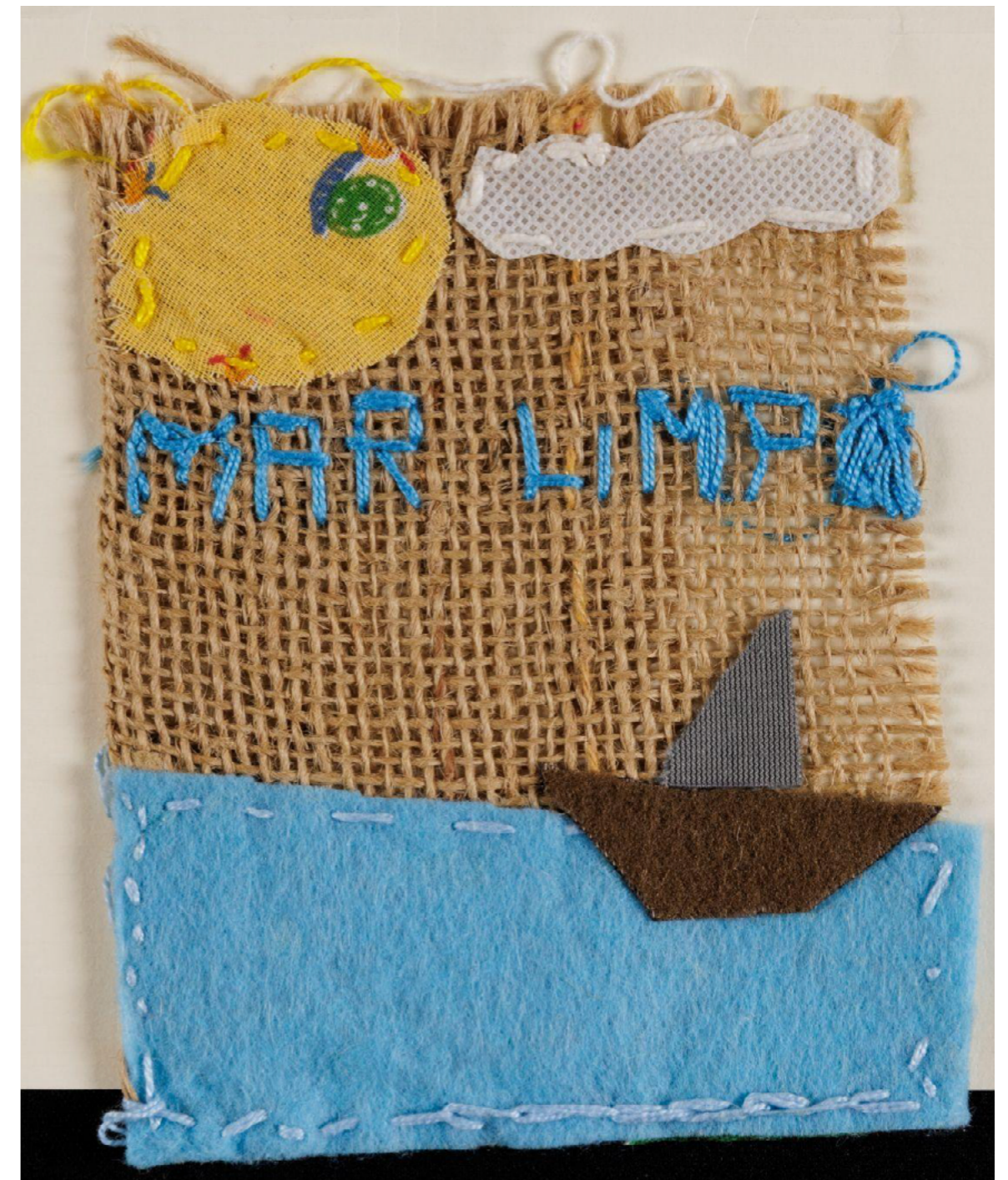
Imagem 7- Bordar as águas - bordado de participantes do grupo

“O mar precisa ser protegido. O oceano é vida.”