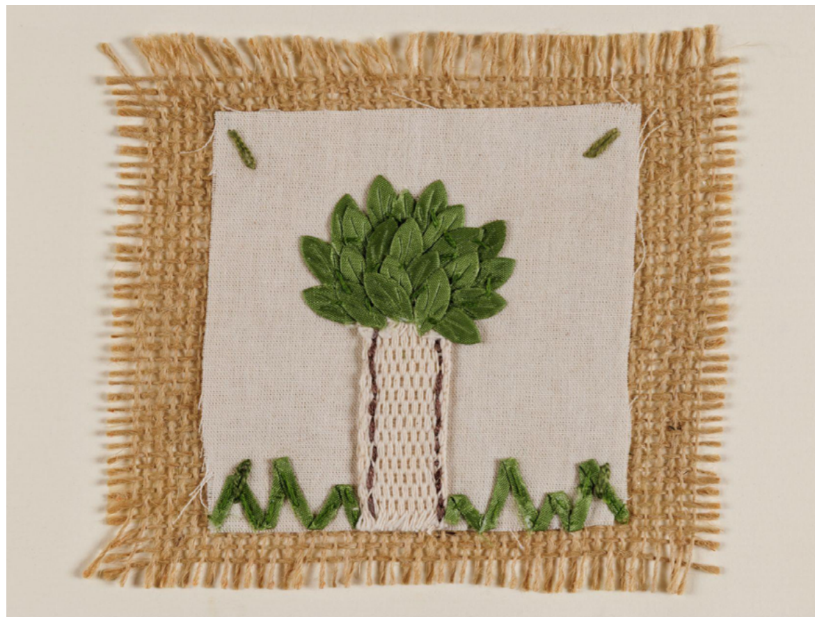
Imagem 6- Plantar árvores é plantar vidas - bordado de participantes do grupo - Fotografia de João Caldas

Destacamos o protagonismo e a percepção de responsabilidade manifestadas na fala e na produção artística. Os bordados anunciaram que plantar árvores é plantar vidas. Toda mobilização é necessária para tornar Santos mais verde.