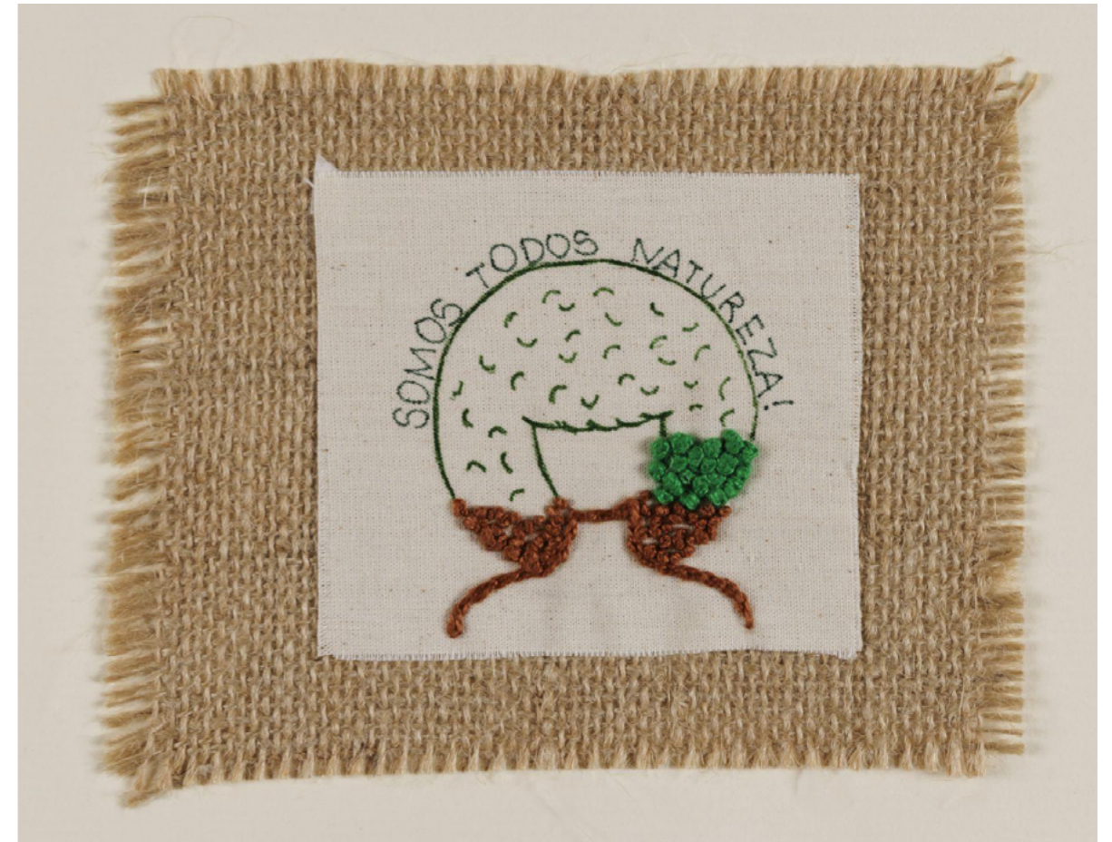
Imagem 5 – Somos todos Natureza - bordado de participantes do grupo

Foram três horas de envolvimento, compromisso e responsabilidade. Inicialmente, muitos não acreditavam em seu potencial criativo; aos poucos, foram encorajados a iniciar. A roda dialogada mobiliza emoções, tradição, ancestralidade, sonho e projeto. É uma manifestação gentil que anuncia — ou denuncia — realidades. O bordado produz suturas no tecido, e o ato de bordar transforma temas em processos de autocuidado e elaboração coletiva. Trabalha-se com nós, linhas, escolhas e direções. Assim como na vida, podemos conservar, transformar ou desatar. As metáforas entre bordado e existência são permanentes. Quando pensamos no bem comum, estamos falando de política. Perguntamos: o que anunciar? O que denunciar? Quais são os sonhos para o nosso território? Nesse sentido, dialogamos com Ailton Krenak quando afirma que “não se trata de salvar o planeta, mas de salvar a nossa capacidade de habitar o mundo” (KRENAK, 2019, p. 23). Habitar o mundo é reconhecer que não estamos separados da Terra, mas implicados nela. Ao afirmar que fomos “descolados da Terra” (KRENAK, 2019), o autor aponta para a raiz simbólica da crise ecológica contemporânea.