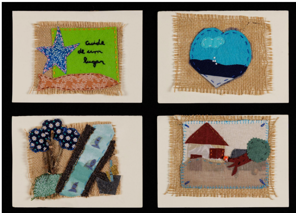
Imagem 12 - Cuidando do Território - bordados de participantes do grupo