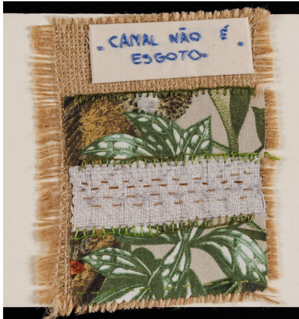
Imagem 10 - Canal limpo, cidade viva -bordado de participante do grupo - Fotografia de João Caldas

“Não queremos esgoto e lixo nos canais.”