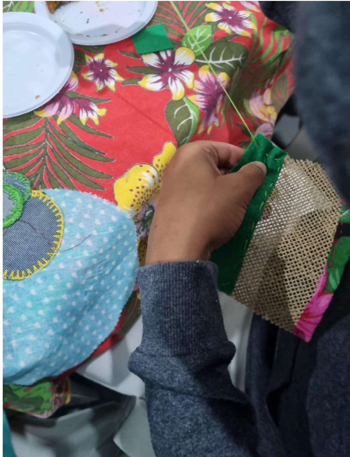
Imagem 4 - Um gesto

O trabalho foi planejado coletivamente. Elaboramos questões disparadoras sobre memória climática, direitos, sonhos e mobilização social. Distribuímos tesouras, retalhos de juta, linhas, agulhas e canetas — valorizando a produção autoral.