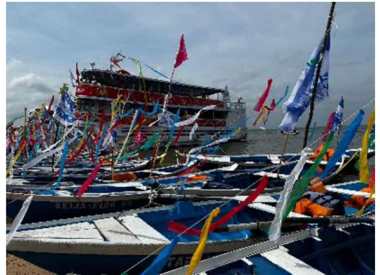
Figura 2 Sairé no Rio Tapajós: travessia ritual.

atua como um exercício de diplomacia cosmopolítica (Latour, 2019), em que o pesquisador abandona a soberania humana para se inscrever em uma rede de interdependências, compreendendo que governar o presente exige, antes de tudo, saber ouvir as agências não humanas que sustentam o tecido da vida. A expedição Walking Seminar 2025 encontra o seu ápice ao ocorrer simultaneamente ao Sairé. Imersas nessa atmosfera, as caminhadas são atravessadas por um território em estado de epifania, onde ritos católicos se entrelaçam a uma ancestralidade indígena vibrante. Para o projeto, o Sairé não é apenas um pano de fundo, mas um dispositivo de agenciamento cultural. O ritual é a manifestação prática da cosmopolítica, onde a divisão moderna entre o natural, o rio, o boto, os troncos, e o cultural, as ladainhas e a política local, dissolve-se (Figura 2).