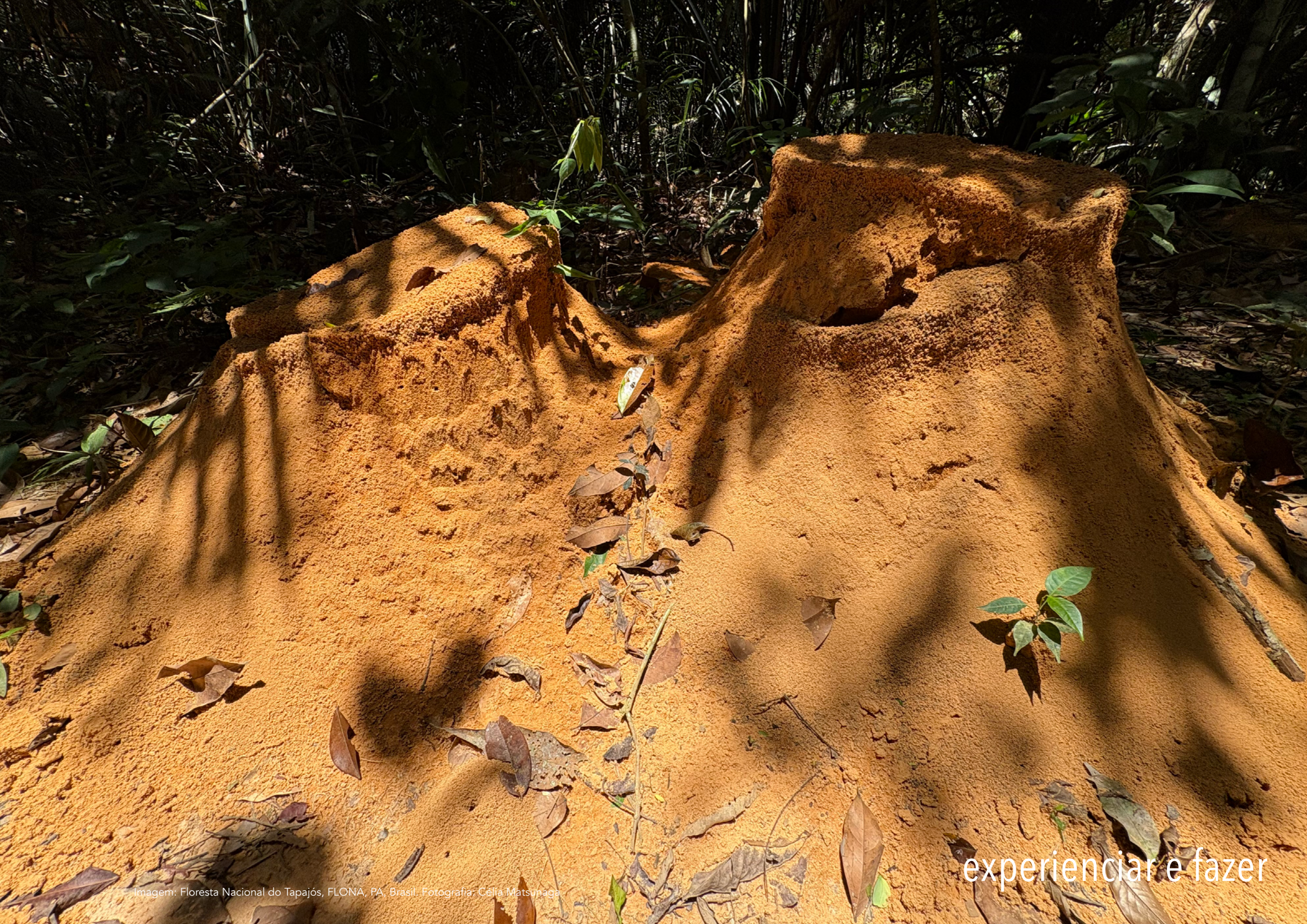
Imagem: Floresta Nacional do Tapajós, FLONA, PA, Brasil.