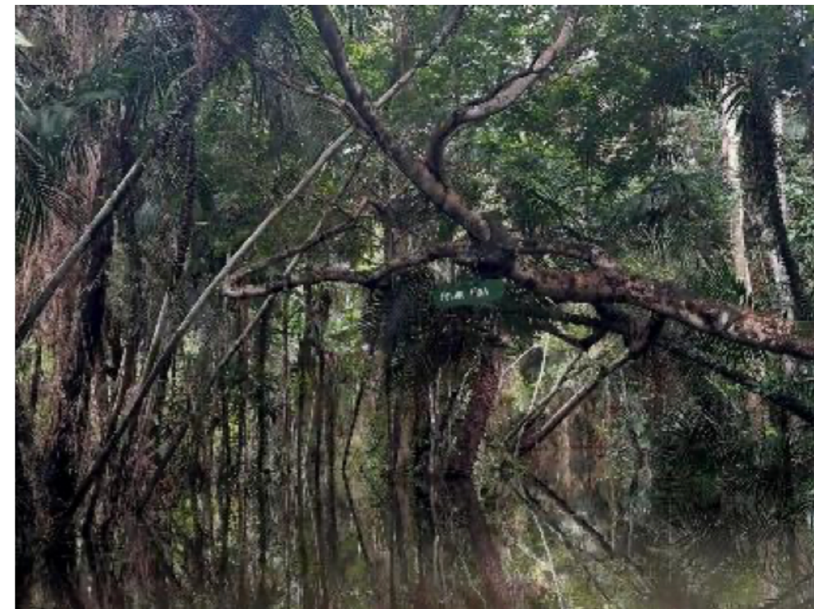
Figura 1 Floresta Encantada, Caranazal: imersão no igapó.

A andança flúvio-terrestre converte-se em método, uma práxis de escuta das ancestralidades que operam na agoridade. É uma reterritorialização do presente, onde a imaginação artística e a presença política se fundem em um gesto de resistência, transformando o ato de caminhar em uma ferramenta de descolonização do pensamento e da imagem (Figura 1).