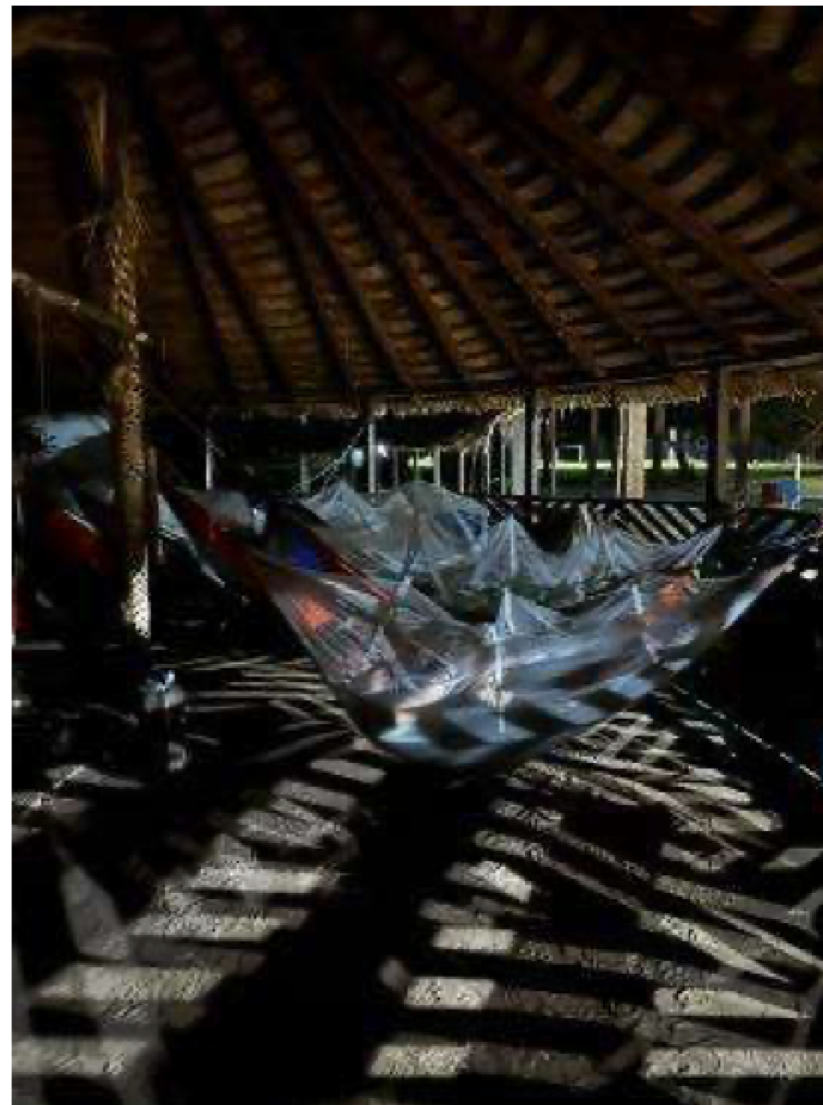
Figura 6 Maloca Munduruku: espaço de composição do coletivo. Fotografia da autora, 2025.

A hospitalidade torna-se o primeiro filtro político para verificar se essa proposta acadêmica é capaz de habitar a morada comum sem fraturar o equilíbrio sensível da vida local. Naquela margem, a política latouriana acontece em estado bruto através de uma tríade de articulações, o humano, a técnica e o não humano. O humano condensado pelo diálogo entre o cacique e os pesquisadores, a técnica desde a presença mediadora do motor, do casco do barco e das lentes das câmeras e o não humano corporificado na agência do curso das águas, a direção do vento e o olhar denso da mata que circunda o porto.