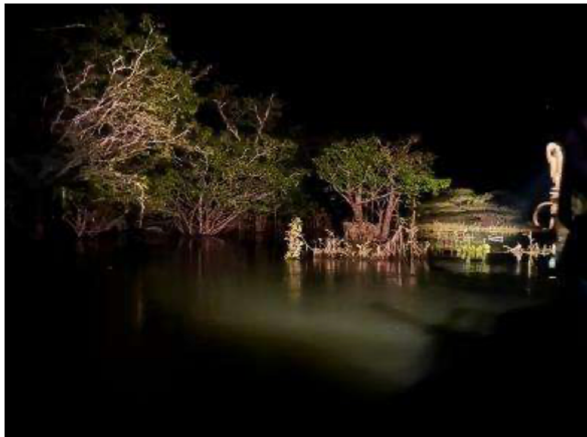
Figura 5 Encontro com o cacique Munduruku: gesto de hospitalidade.

O encontro constitui um campo de negociação situado entre coletivos humanos e não humanos. Nesse encontro, a figura do líder indígena não representa apenas a soberania humana. Ela expressa a voz de um coletivo expandido que inclui peixes, vegetação e o próprio rio. Sua presença na margem não é apenas um gesto de recepção, mas uma forma de leitura do território e das intenções que nele se inscrevem. O encontro torna-se, assim, um momento de suspensão e avaliação, no qual a entrada do outro depende de uma escuta atenta às relações já existentes.