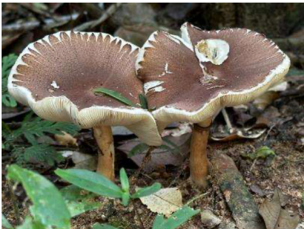
Figura 4 Relações multiespécies na FLONA do Tapajós.

A vila de Alter do Chão emerge aqui como o ponto focal de uma agoridade, um tempo presente denso, onde o enraizamento não é estático, mas um fluxo de relações sincrônicas. Sob a ótica de Tsing (2019), os caminhantes e idealizadoras do projeto não apenas percorrem o solo, elas praticam uma fricção epistemológica, o encontro produtivo e por vezes desconfortável entre o saber acadêmico e a imanência da floresta.