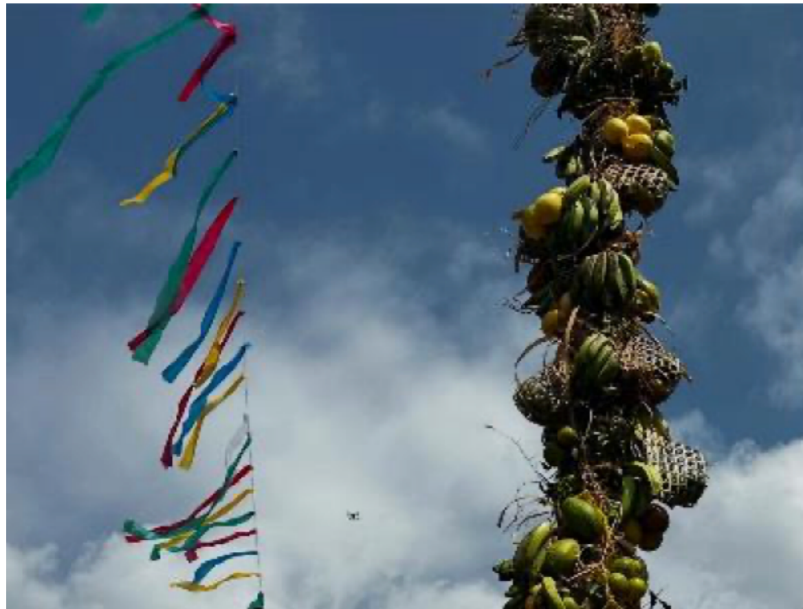
Figura 3 Mastros do Sairé: actantes botânicos.

Nosso método flúvio-terrestre de andança, portanto, opera como um dispositivo diplomático, na terra, tenciona a gravidade do corpo e o enraizamento; na água, ele exige a entrega ao fluxo e à agência do rio. Durante o Sairé, essa prática de deslocamento converte-se em uma escrita de si e do mundo, onde o ato de notar as alianças multiespécies, permite que a investigação ateste a construção contínua de um mundo comum, onde a sobrevivência é, acima de tudo, um gesto de hospitalidade mútua.