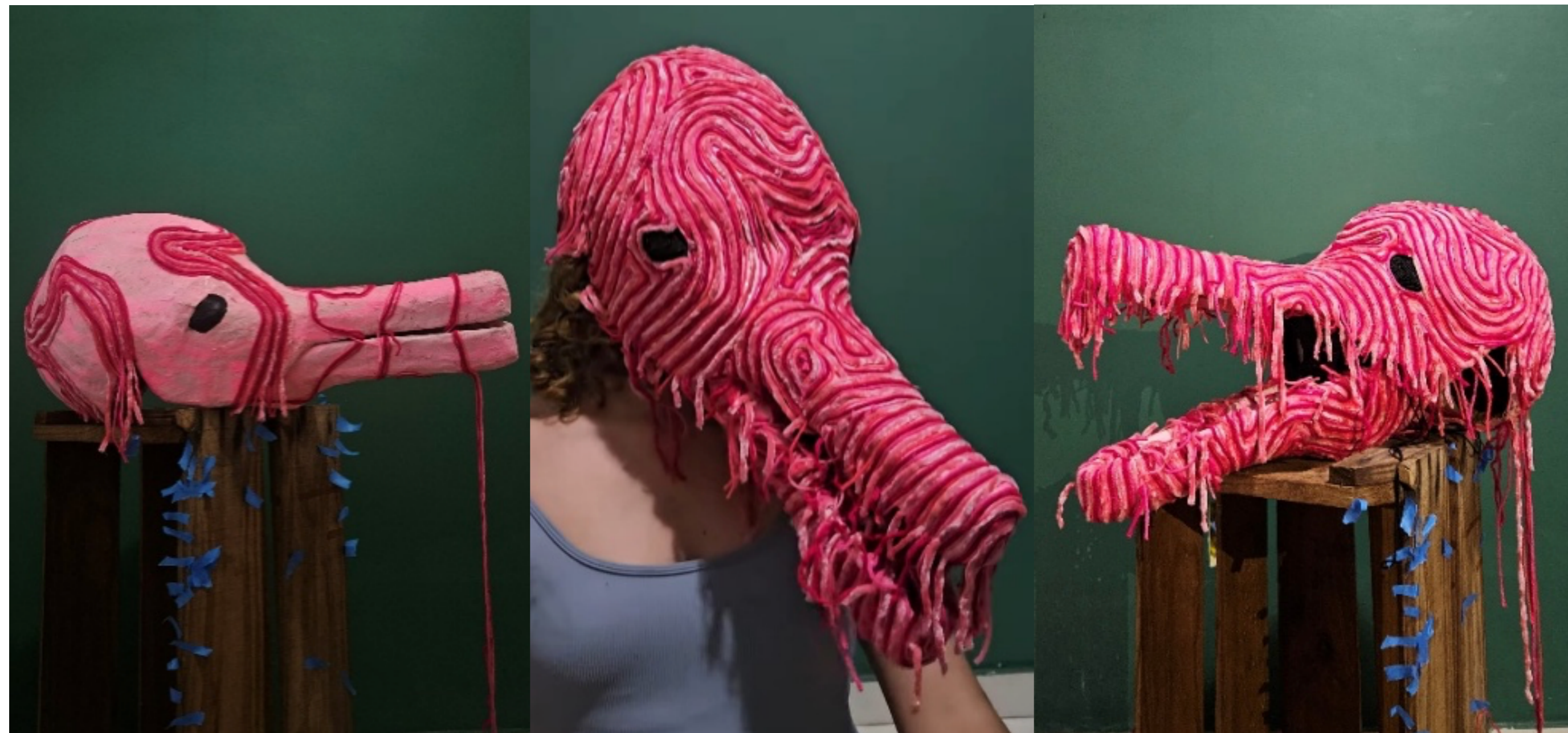
Figura 9, 10 e 11 – Máscara Boto – Cor – de – Rosa

materialidade. Em sintonia com o ambiente do rio a festividades locais, a máscara surge como uma figura humana-não-humana já presente nos ritos, nas místicas e narrativas da região.