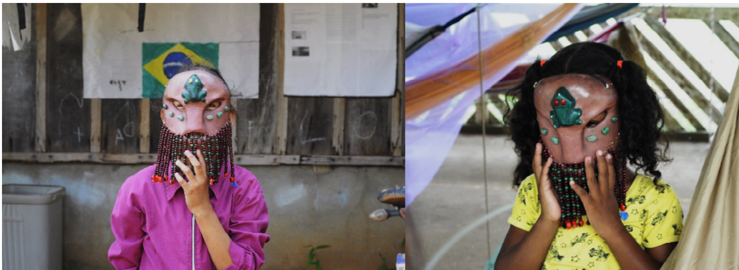
Figura 1 e 2- Máscara muiiraquitã

Assim, o território deixa de ser compreendido como cenário passivo e passa a ser reconhecido como agente ativo na produção da vida, constituído por múltiplas presenças que coexistem sem se reduzir umas às outras.