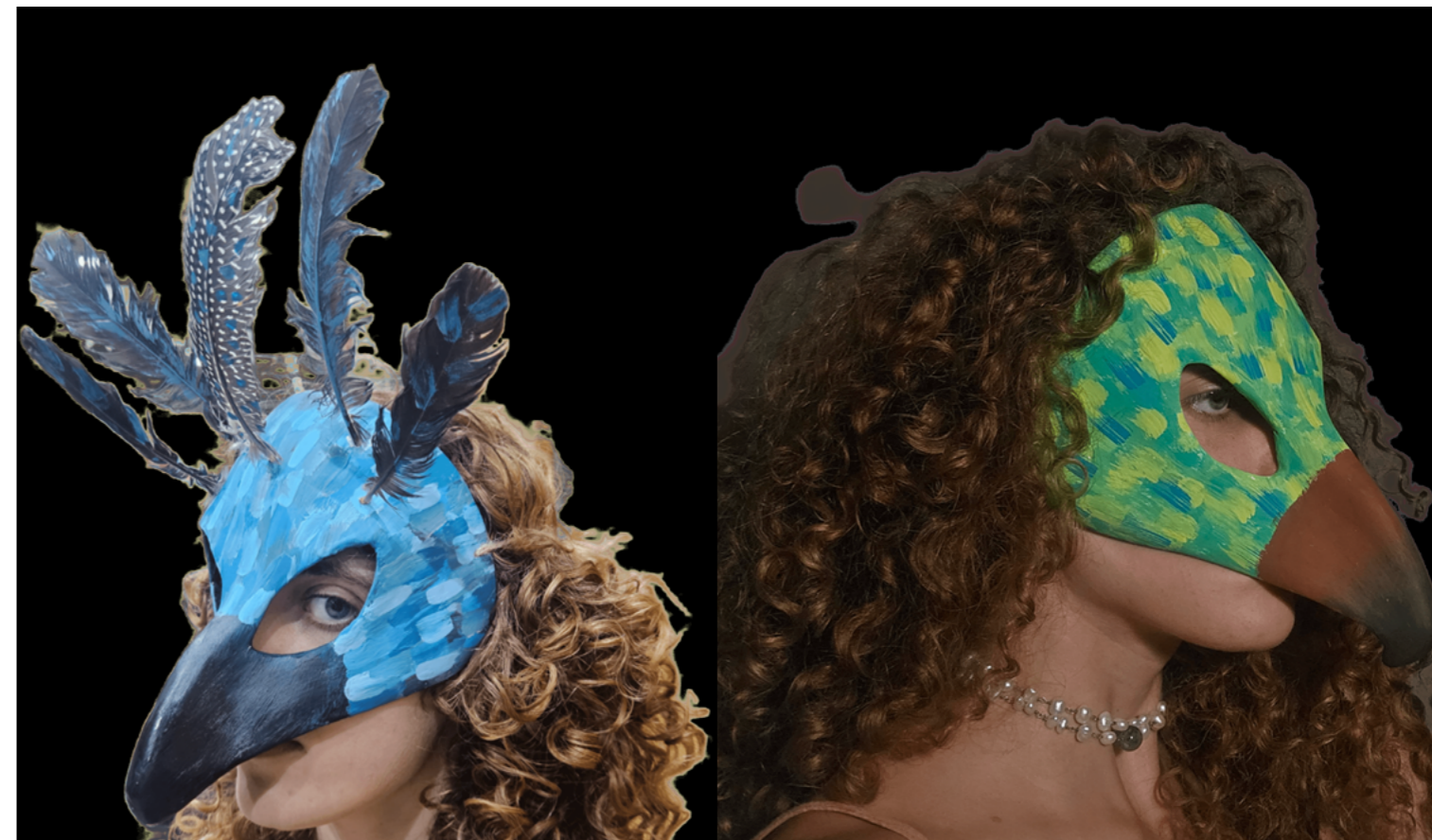
Figura 12 e 13 – Máscaras aves.

Ao mesmo tempo, a máscara pode ser entendida como um espaço de confluência, no sentido proposto por Antônio Bispo dos Santos. Em vez de dissolver as diferenças entre espécies ou identidades, ela coloca em relação múltiplas formas de existência, permitindo que coexistam sem se reduzir umas às outras. O corpo mascarado não deixa de ser humano, mas passa a existir em relação com outras presenças, animais, vegetais, espirituais, que atravessam sua experiência.