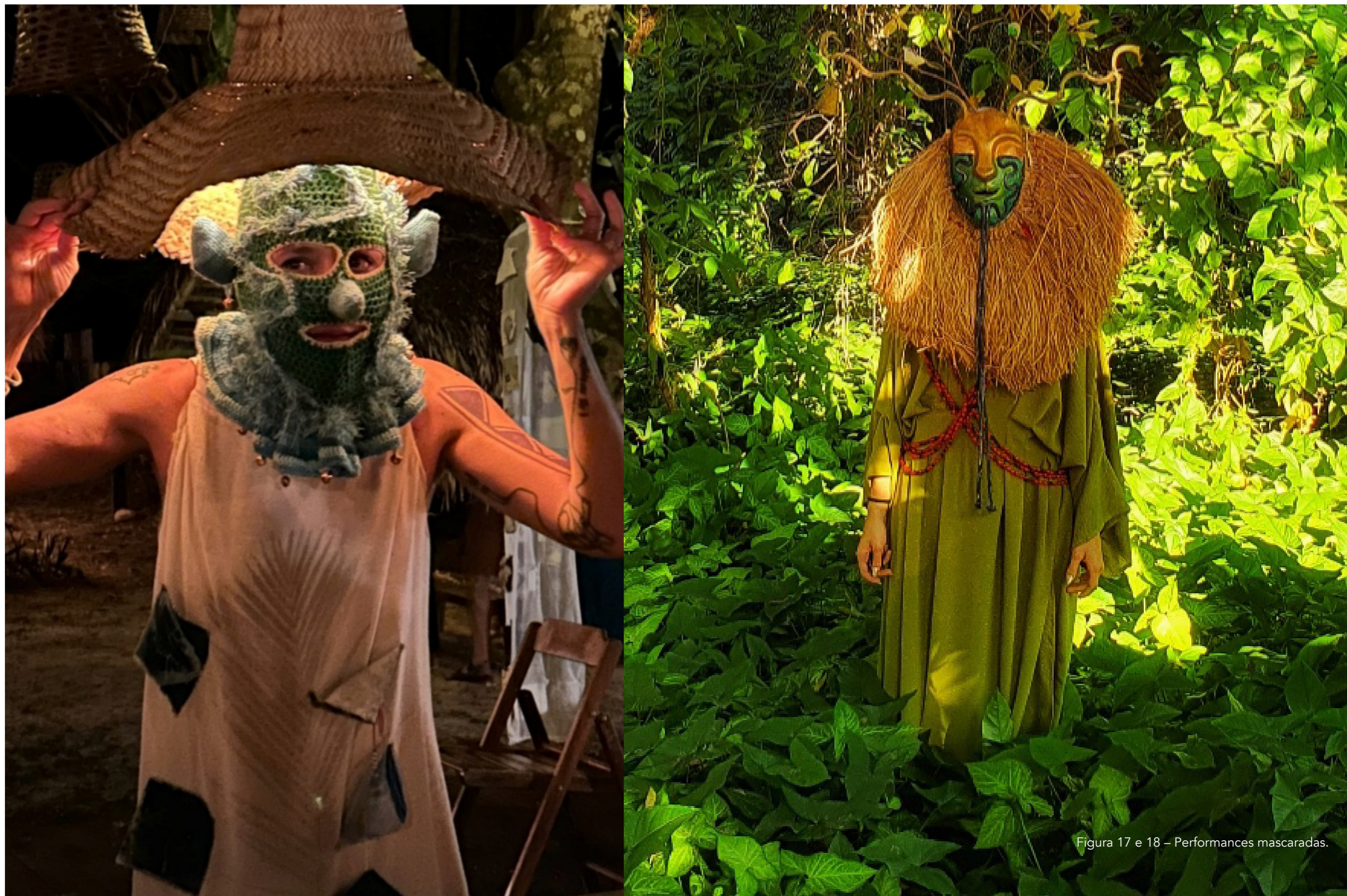
Figura 17 e 18 – Performances mascaradas.

As performances em contexto de floresta intensificam mais esse processo. O território, com sua densidade vegetal, irregularidade do solo e multiplicidade de sons, compõem condições que reorganizam a performance e o ritmo do corpo, passa a ser uma resposta às forças que emergem do ambiente, deixando de ser uma ação sobre o espaço. O corpo compõe com o território essa dança mascarada.