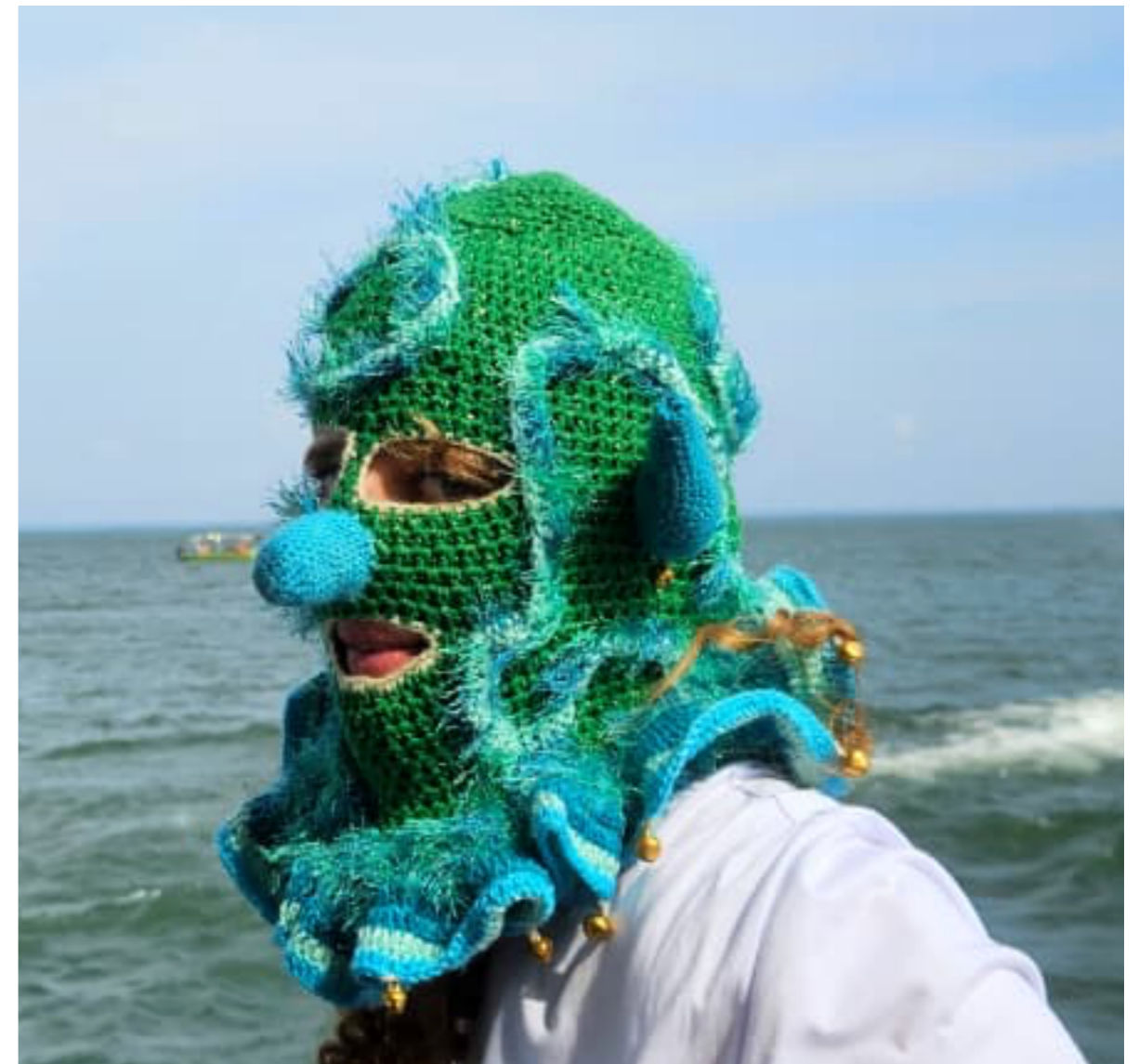
Figura 3 – Máscara Têxtil Fio/Rio

Aplicada ao campo da prática artística, essa abordagem implica compreender que os materiais, como: madeira, tecidos, fibras, pigmentos, são participantes ativos do processo de criação. Cada material impõe resistências, possibilidades e limites, configurando um diálogo com o corpo que o manipula.