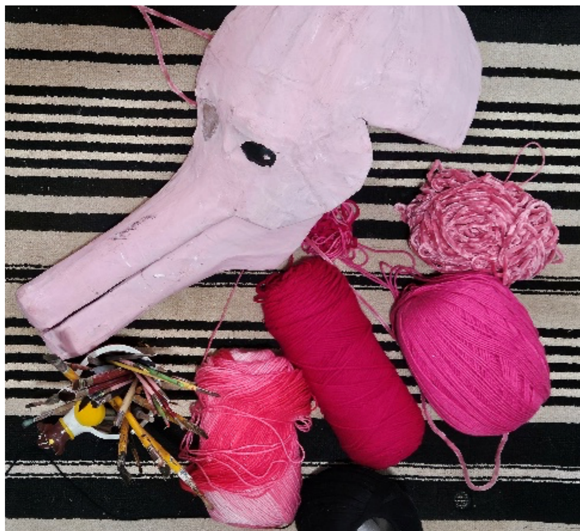
Figura 19 – Máscara Boto-Cor-de-Rosa

Essa dimensão é reforçada pelas materialidades utilizadas, especialmente nas máscaras têxteis, que evocam texturas associadas à água, ao fluxo e à continuidade. O tecido, ao contrário da rigidez da madeira, permite movimentos mais flexíveis, acompanhando o corpo e criando superfícies que sugerem deslocamento e mutação. A materialidade participa da experiência que ela produz.