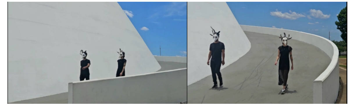
Figura 13 e 24 – Máscara Urubu

No contexto urbano, essas performances produzem um efeito de ruptura nos regimes perceptivos dominantes. A presença de corpos mascarados em espaços marcados pela racionalidade técnica e pela aceleração cotidiana introduz uma fissura na percepção habitual, tornando visível a artificialidade das separações entre humano e natureza. O estranhamento gerado por essas presenças evidencia que a dimensão mais-que-humana não está ausente da cidade, mas apenas invisibilizada.