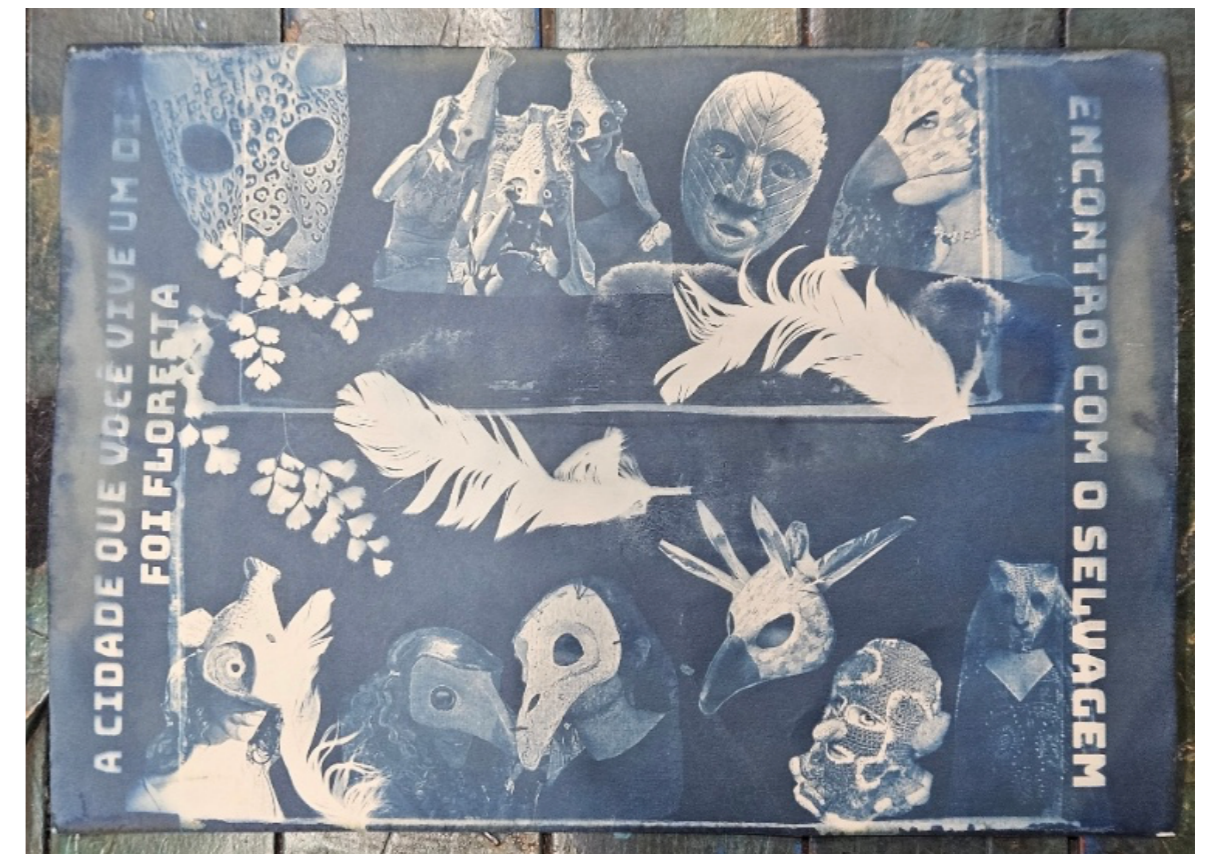
Figura 25 - Cianotipia 'Encontro com o Selvagem'

A cidade que você vive um dia foi floresta; encontro com o selvagem.