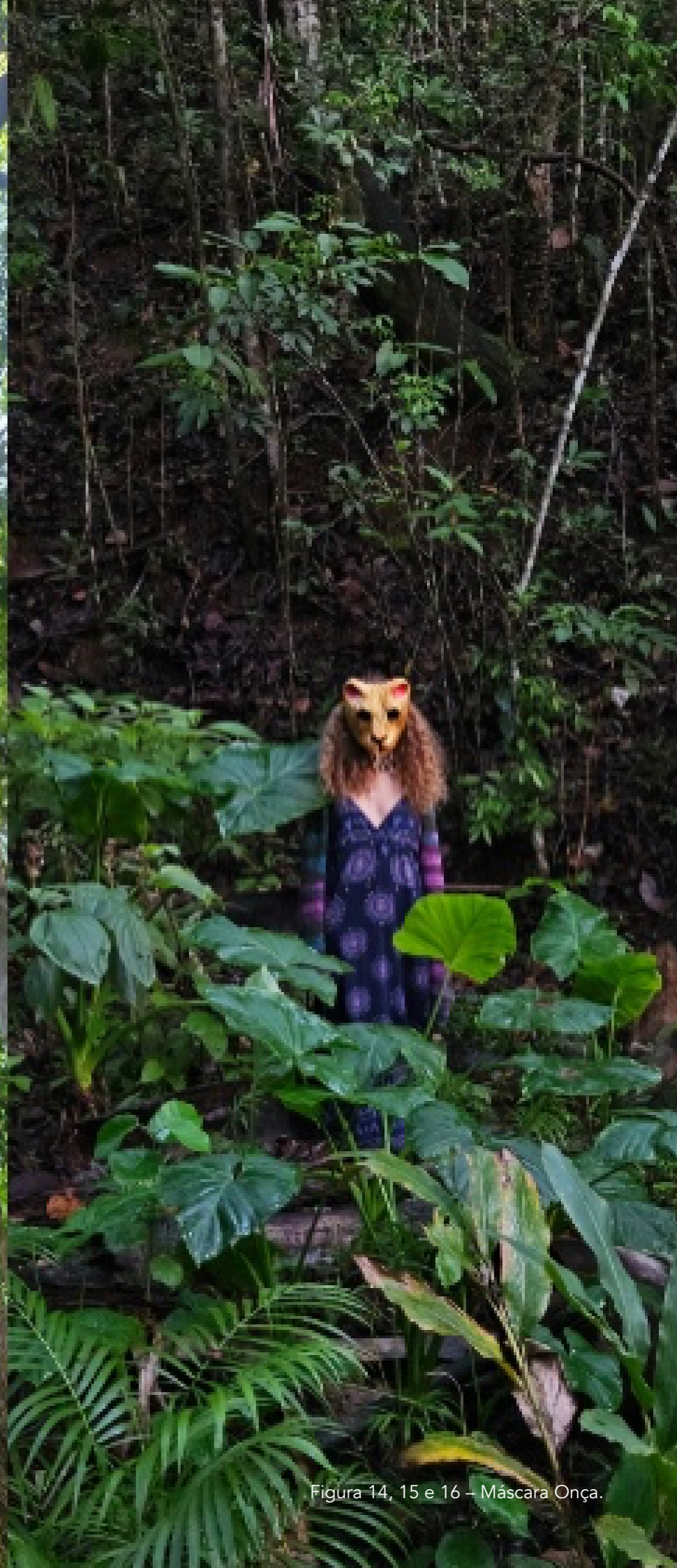
Figura 14, 15 e 16 – Máscara Onça.