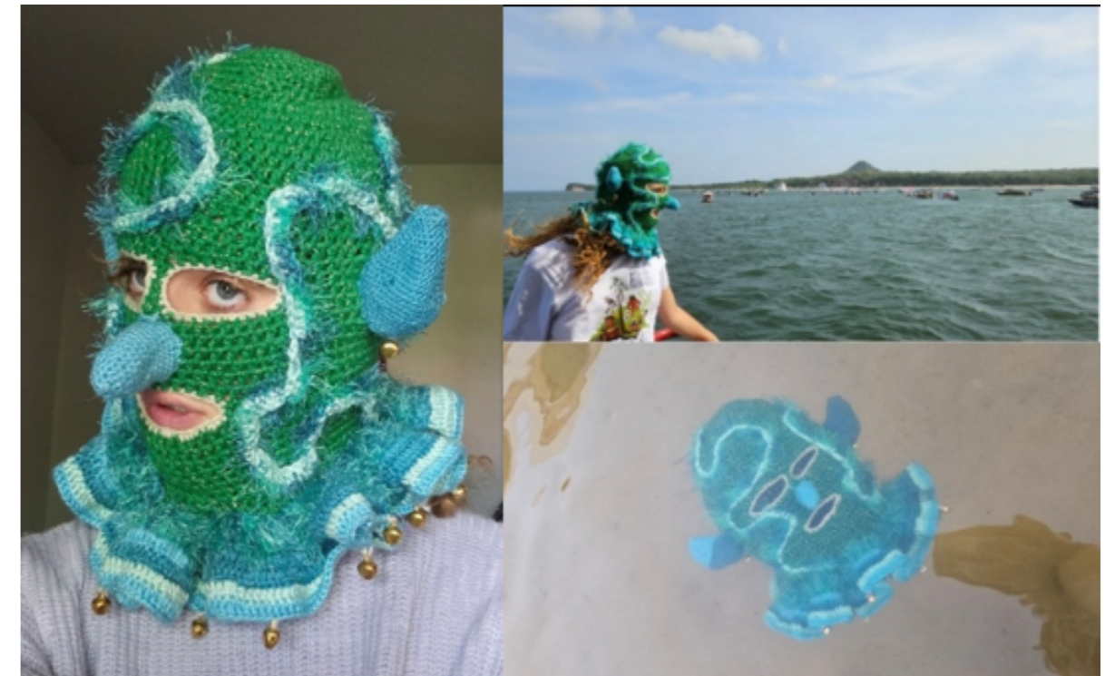
Figura 6, 7 e 8 – Máscara Têxtil Fio/Rio