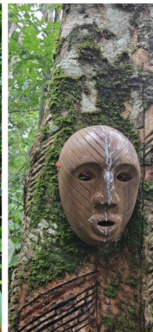
Figura 20, 21 e 22 - Máscara seringueira