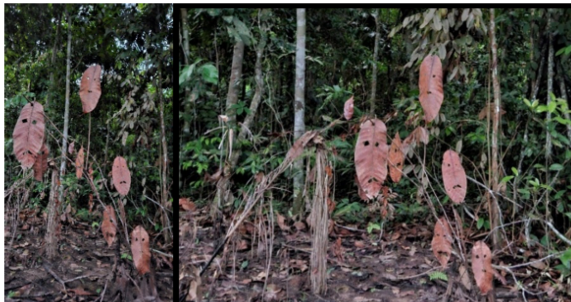
Figura 4 e 5 – Máscaras folhas.

A investigação desenvolvida neste trabalho adota uma abordagem metodológica desenvolvida por meio da imersão do corpo em relação com o território, onde o conhecimento não é produzido a partir do distanciamento entre sujeito e objeto. O caminhar, a escuta e o fazer artístico configuram-se como práticas metodológicas que permitem acessar dimensões sensíveis e relacionais do espaço, frequentemente invisibilizadas por abordagens analíticas tradicionais. O caminhar constitui-se como um procedimento central dessa investigação. Longe de ser um deslocamento funcional e deve compreendido como uma prática de atenção, onde o corpo se torna sensível às variações do ambiente. Ao andar pelo território, o corpo atravessa o espaço e é atravessador por ele, pelos ritmos, texturas, sons e presenças. O caminhar opera como um dispositivo de abertura perceptiva, permitindo que o pesquisador se insira em um campo relacional mais amplo.