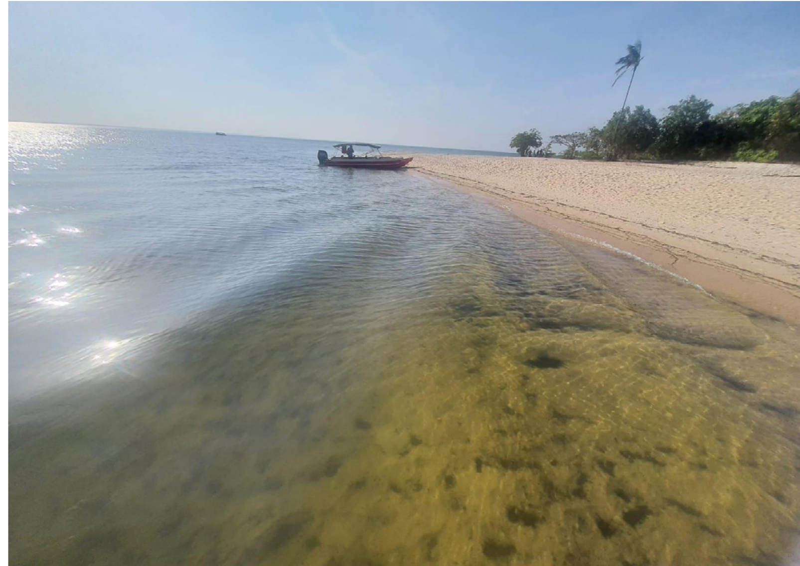
Figura 5: Entre águas e florestas em comunidade ribeirinha

A madeira que nos sustenta no chão que sobrepõe a floresta, e que engloba meu simples copo de chá, é outro momento da vida da floresta. Suas raízes e copas estão, felizmente, muito próximas de nós enquanto conversamos e eu bebo meu chá. A floresta viva em suas muitas formas traz em cada um diferentes sentimentos e narrativas. A subjetividade de cada um é um sopro para a floresta e suas águas, novas formas de contar a vida e o tempo.