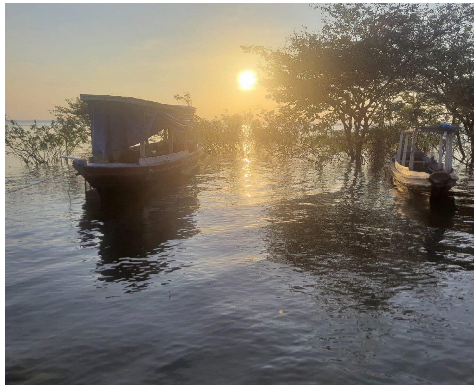
Figura 3: Barcos no rio Tapajós

A cor roxa da árvore, com suas cascas repletas de diferentes tons de marrom, tem um sabor amadeirado, doce, e traz todo caminho dos encantados que nos guia pelas florestas. A água, mãe da vida, traz lara e muitas outras encantadas que mergulham nos rios amazônicos. O cacique Domingos nos contou da encantada que vive no igapó, a irmã dele estava lá quando viu um saco repleto de ouro, e quando tentou alcançá-lo quase foi levada para dentro dos rios com ele. A vida na floresta é muito mais complexa do que podemos imaginar.