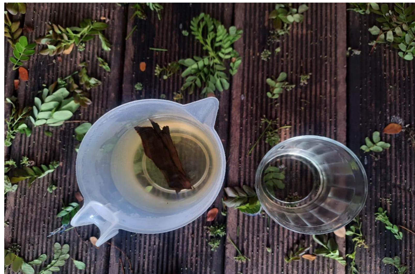
Figura 1: Foto do chá dado pelo cacique, 2025

This visual essay was created within the context of the Walking Seminars experience, as part of the Textile Cartographies project. It recounts different moments of the experience, but in a poetic way, conveying impressions and feelings. Typically, my gaze turns to the details within experiences, such as a tea, a stream of tadpoles from the famous Cururu toad, present in a well-known Brazilian lullaby. This experience was filled with waters—the waters of rivers, flooded forests, tea, the paths of boats—which is why these details are all connected to water, its cycles and stories, its different forms of life: From the waters that surround us to the enchanted ones, spirits of the forest, the experience also touched upon the feminine aspect of water and life. The feminine is charged with resistance, and here resistance is also reflected in the struggle of Indigenous peoples to keep the forest standing and its waters clean. Nature does not need words to express itself, its language goes far beyond, reaching through all our senses. Indigenous peoples, more connected to it, have the possibility of experiencing nature's relationship with the senses in a deeper way, as if it were an interspecies dialogue, one of respect and active listening. This text attempts to enter these languages and participate in this dialogue.