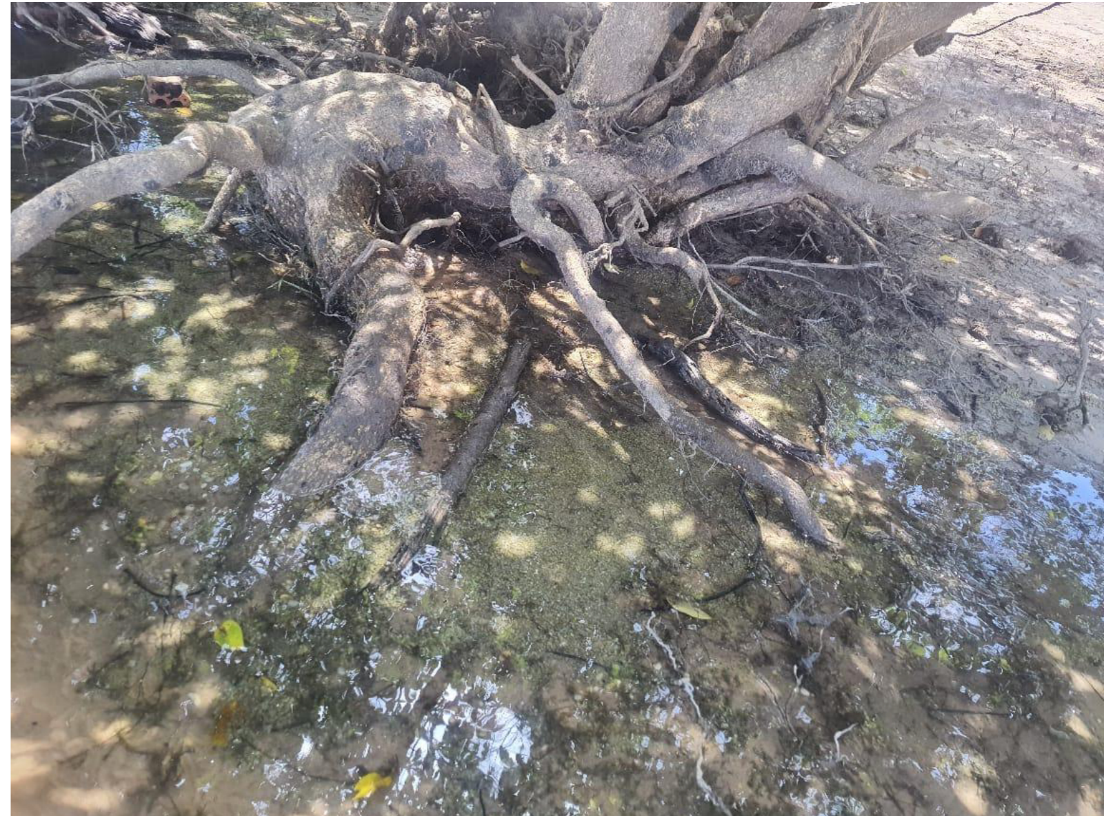
Figura 4: Árvore amazônica em Alter do Chão

A água que nos apresentou a reverência pela força da floresta e seu povo foi a mesma que nos banhou nesta noite, nos alimentou e cujo chá curativo também é feito. A árvore é englobada pela água ao se fazer o chá. A terra, a água, nutre as raízes da árvore. São muitos ciclos passados até chegarmos ao chá, o conhecimento humano e não humano. Será que a árvore conhece seu poder?