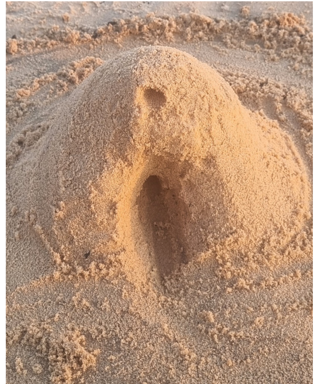
Figura 9. Casa areia, autoria própria.

Que rios, areia, terra e cerâmica se encontrem, tecendo juntos a memória e a vida de cada espaço, fazendo da cidade e da floresta um lar que pulsa, onde tudo se transforma e tudo se integra.