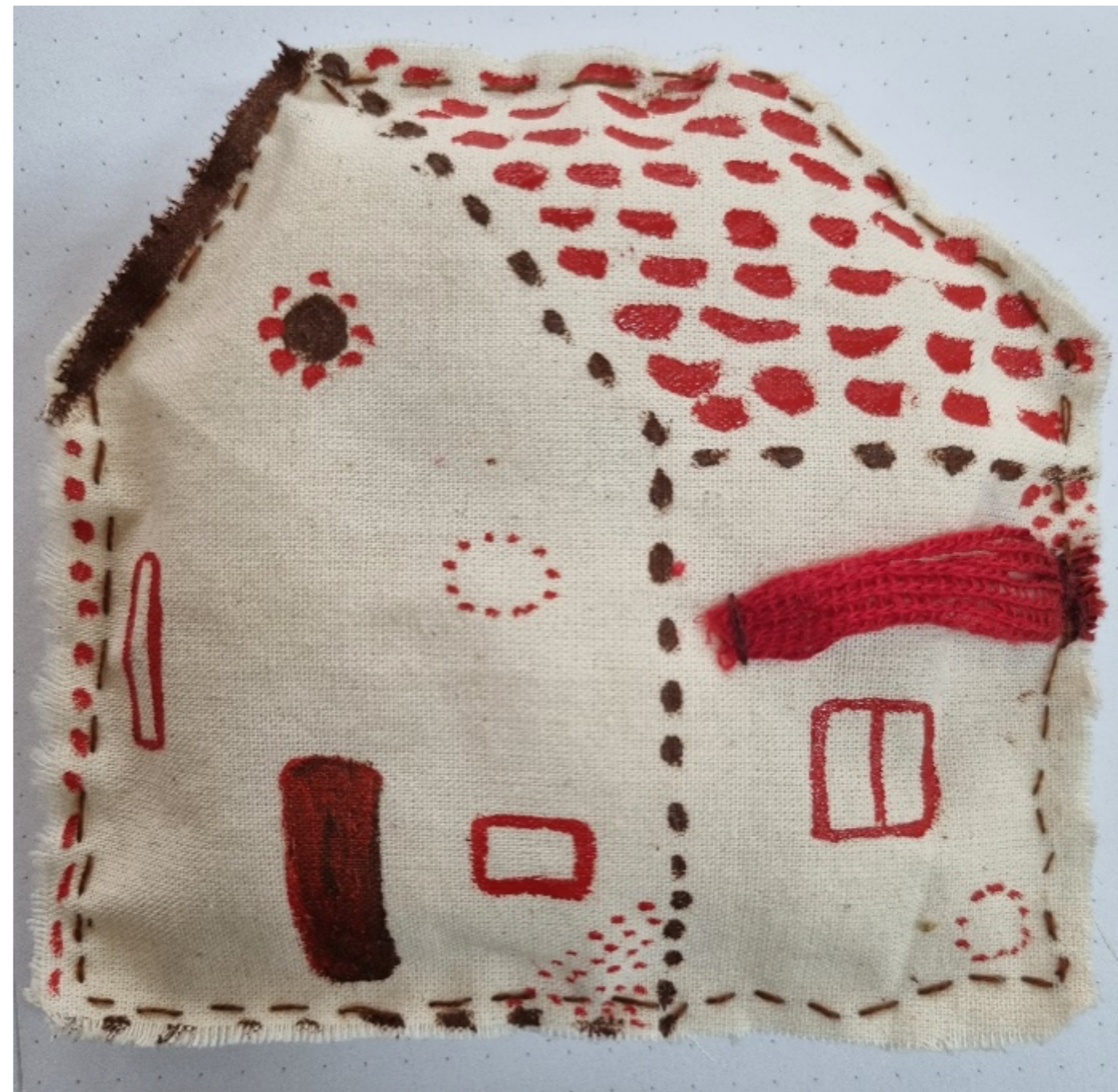
Figura 10 e 11. Casa raiz, e casa. Autoria própria, bordado e tecido, Walking Seminar 2025.