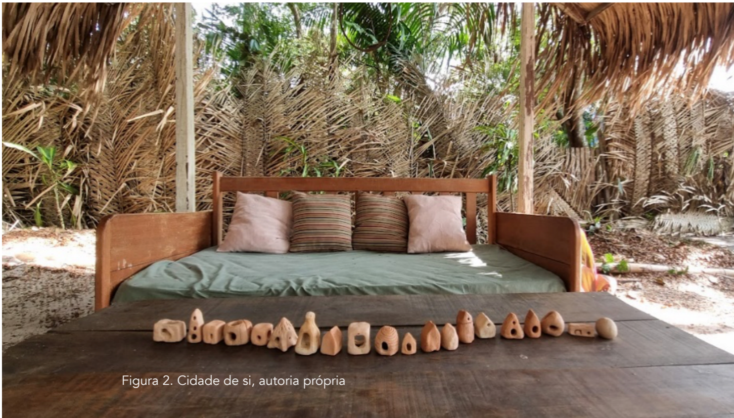
Figura 2. Cidade de si, autoria própria