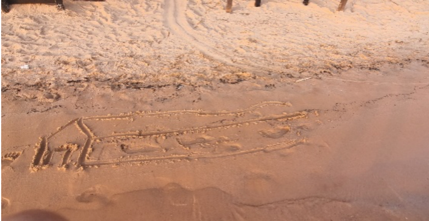
Figura 1. Santarém - Pará, Autoria própria.