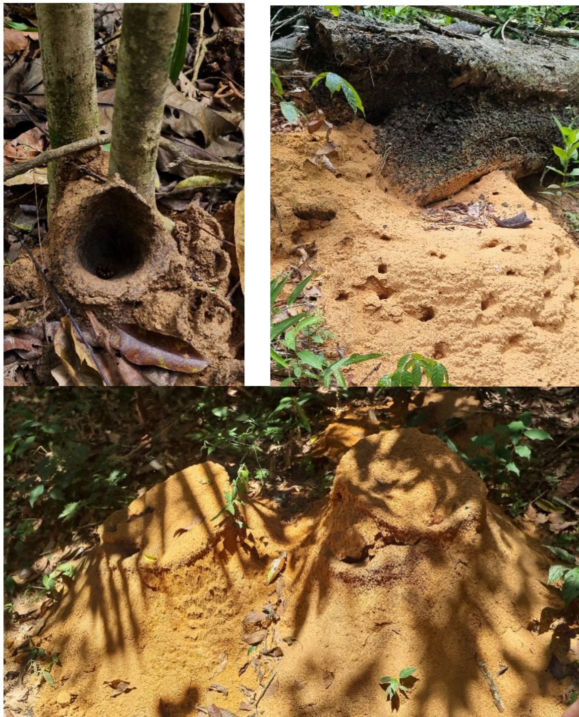
Figura 6, 7, 8. Flona Tapajós, Pará.

Chegar até o outro lado, encontrar a maior árvore, caminhar em conjunto, observar formigas perfumadas: estar em contato com a natureza. O Pará merece ser respeitado, assim como sua floresta, seus povos, suas tradições e cidades. Histórias são tecidas todos os dias; territórios maltratados, violência que tenta apagar aquilo que jamais deveria ser apagado. A natureza é o que nos mantém vivos. Morar e cuidar desse lugar é assumir o papel de guardião da vida. Cada gesto de cuidado e atenção ao que nos cerca é também um ato de pertencimento e de amor pelo território.