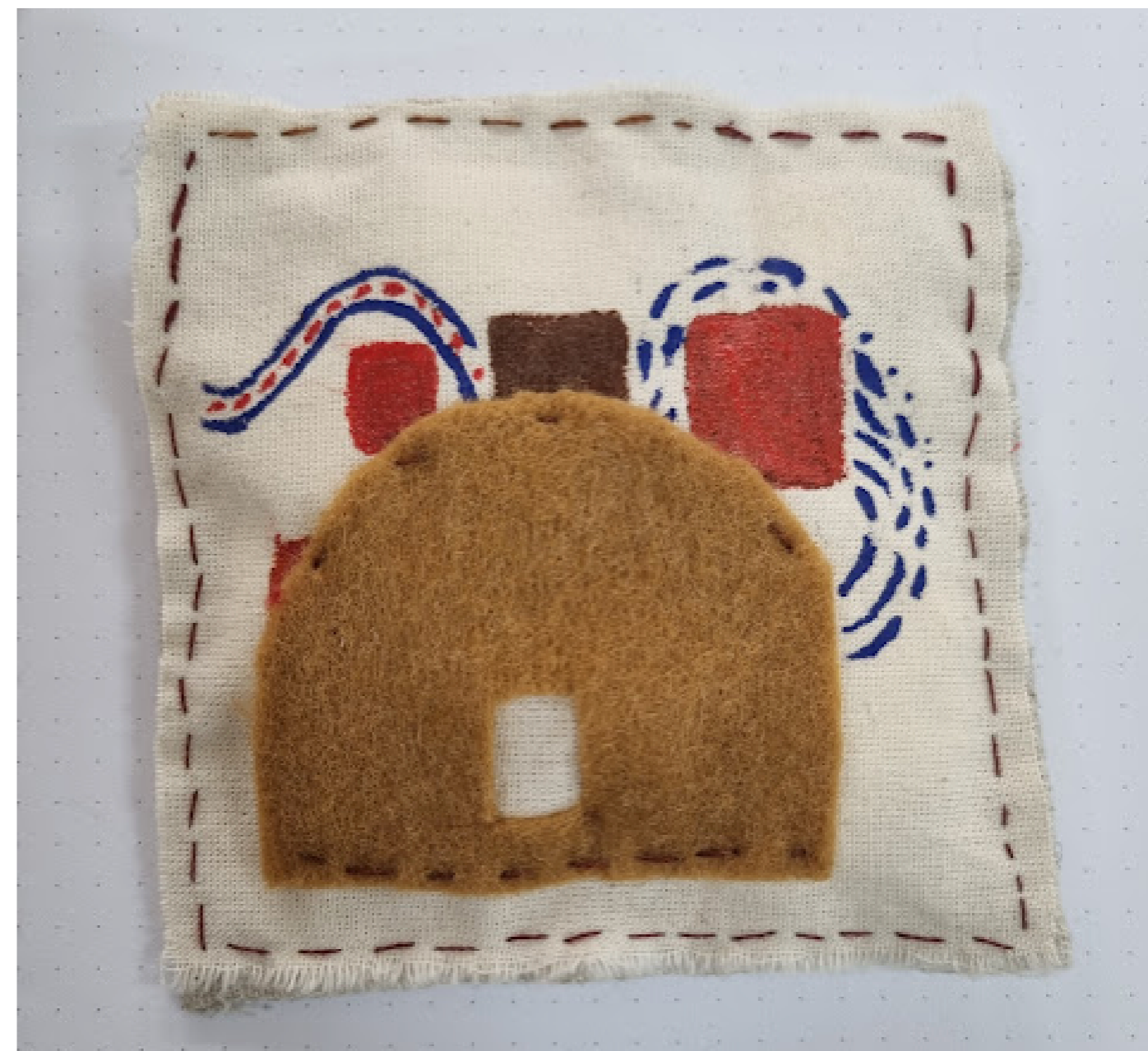
Figura 12. Toca, Autoria própria, bordado e tecido.

Neste ensaio poético, procurei pincelar os trabalhos que desenvolvi ao longo de 2025, até chegar em Santarém, expondo em conjunto bordados de 10x10 cm para o projeto Walking Seminar . Cada bordado carrega sua própria história, que se desloca para outros lugares, reverberando as narrativas criadas e ampliando os caminhos de cada criação.