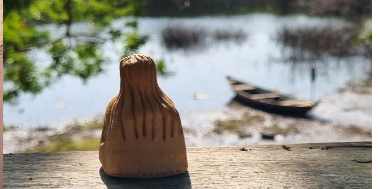
Figura 3. Olhar sobre o rio.