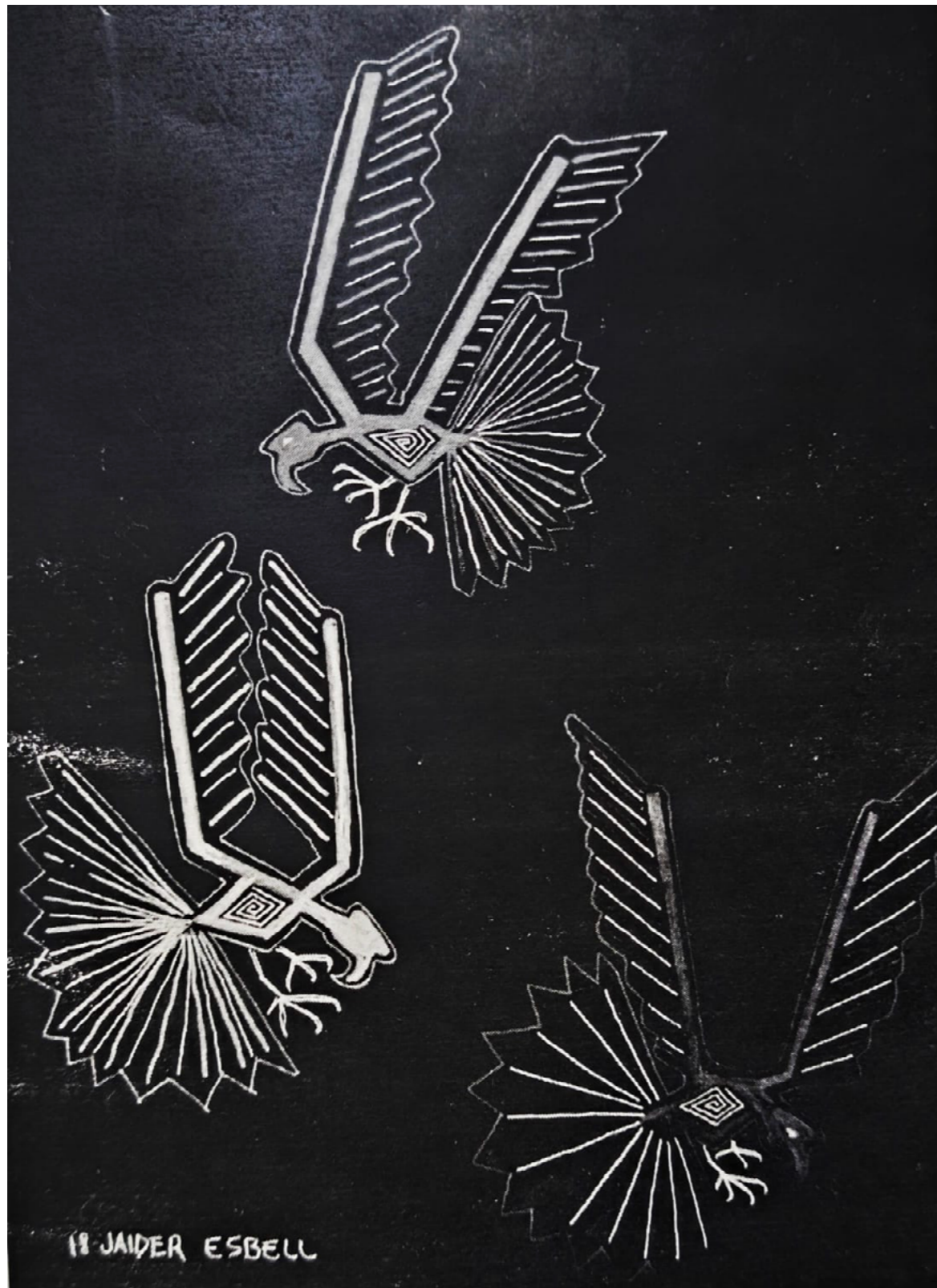
Figura 1: ESBELL, Urubua Kamiranga, 2018.

É a busca por um propósito, sentido de vida. Chega a ser coletivo numa cosmovisão. Os sonhos também são coletivos quando representam desejos únicos de uma comunidade, mas enquanto fenômeno individual ou de experiência mental pode servir de conexão para a espiritualidade. É o respeitar pelos mais antigos, suas histórias também se conectam. É quando o passado, presente e futuro se encontram gerando um eternismo aqui representado pela ciência, espiritualidade e pensamento. Seria esse o caminhar da arte indígena contemporânea numa demonstração de provocação?