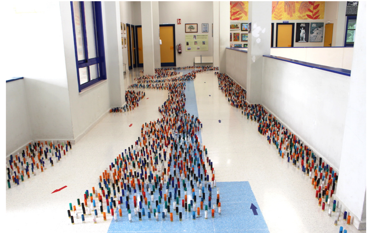
Figura 3. Caminos de resiliencia formados con vainas de escopeta en la instalación "Jardín Planetario". (Imagen propia).

Las vainas de escopeta no solo fueron elegidas por su disponibilidad y bajo coste, sino también por su fuerte carga simbólica, aludiendo a la idea de "lucha" y promoviendo una reflexión sobre el impacto de la guerra (Figuras 1 y 2). Además, estos caminos redibujaban la trayectoria natural de los usuarios del espacio, forzándolos a desviarse de su recorrido habitual y sacarlos de su rutina. El objetivo era generar una pausa para la reflexión, provocando un momento de consciencia que los apartara de la monotonía diaria (Figuras 3 y 4).