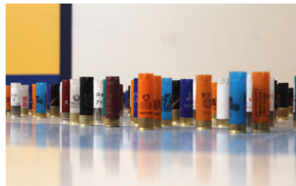
Figura 2. Detalle de los materiales reciclados utilizados en la instalación "Jardín Planetario". (Imagen propia).

Las vainas de escopeta no solo fueron elegidas por su disponibilidad y bajo coste, sino también por su fuerte carga simbólica, aludiendo a la idea de "lucha" y promoviendo una reflexión sobre el impacto de la guerra (Figuras 1 y 2). Además, estos caminos redibujaban la trayectoria natural de los usuarios del espacio, forzándolos a desviarse de su recorrido habitual y sacarlos de su rutina. El objetivo era generar una pausa para la reflexión, provocando un momento de consciencia que los apartara de la monotonía diaria (Figuras 3 y 4).