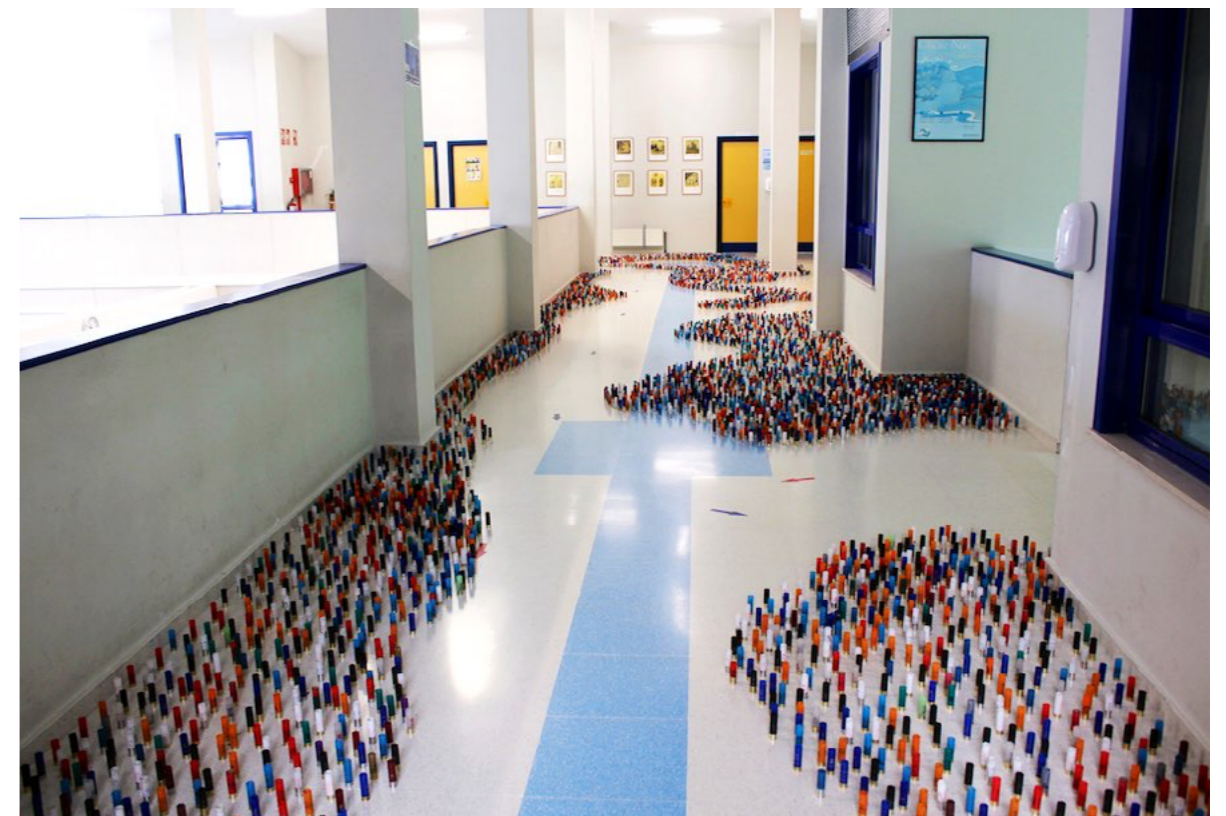
Figura 4. Vista general de la instalación "Jardín Planetario"..