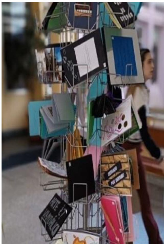
Fig. 1. Caleidoscopio urbano : Expositor con los postaleros de los/as estudiantes en la facultad.

El proyecto comienza con una aproximación a los conceptos de entorno construido y deriva situacionista (AUTOR, 2022). Desde estas premisas los estudiantes se van introduciendo en el lenguaje visual y, en particular, en la idea de serie y narratividad visual mediante el análisis de referentes artísticos y propuestas prácticas vinculadas a su entorno. Posteriormente comienzan a crear su postalero (o álbum postal) alternativo de la ciudad compuesto de