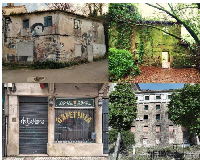
Fig. 5. Denise Lobeiras Casal: Cerrado por derribo. Títulos: Mis raíces / Noches enteras contigo, sintiendo que nos comíamos el mundo. / Nuestro último café juntos... / El lugar en el que vivo desde que ya no estás ya no lo llamo casa.

El tema escogido para mi postalero es el de los edificios abandonados, ya sean tan sólo negocios que cerraron y no volverán a abrir nunca más o casas tapiadas que ya no volverán a ser habitadas.