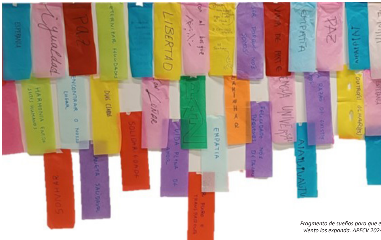
Fragmento de sueños para que el viento los expanda. APECV 2024

Los sueños parecen al principio imposibles, luego improbables, y luego, cuando nos comprometemos, se vuelven inevitables - Mahatma Gandhi. Overflow (2024)